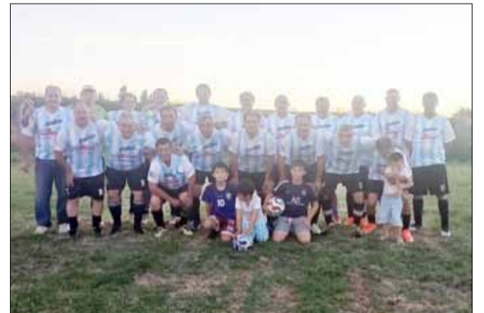
Plantel de Argentino.

Se jugó este domingo por la tarde-noche, la segunda fecha del torneo senior para mayores de 50 años en la cancha del Club Talleres. Para destacar es la confirmación de un conjunto representativo de Olavarría, que dio el visto bueno para sumarse a este torneo por primera vez y debutó con un empate. Estos fueron sus resultados: