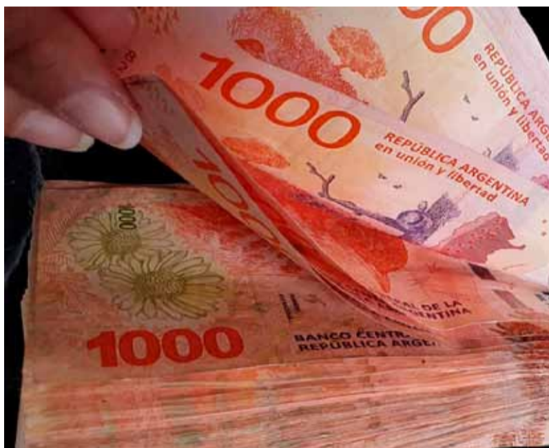
El plazo fijo. Ajustó su rendimiento tras la decisión del BCRA.

BONO DEL TESORO NACIONAL EN PESOS CON AJUSTE POR CER 1,80% VENCIMIENTO 9 DE NOVIEMBRE DE 2025 (TE11) BONCER TX25 09/11/2025 $ 11.073,74.///