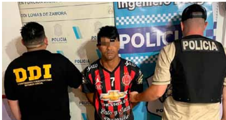
Detenido. Por el horrendo crimen en Lomas de Zamora

Asimismo, sus cuentas se llenaron de mensajes por parte de amigos y familiares, quienes expresaron el “dolor” que sienten por su crimen: “Sigo sin creerlo. Sos esa persona que todos quisiéramos tener en nuestras vidas. Ibas por todo en este mundo sin importar nada, una chica con un corazón inmenso con muchos sueños que cumplir y te arreba-