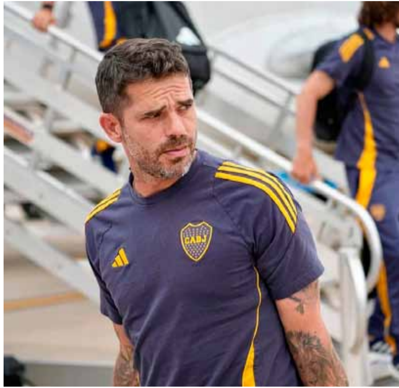
Boca. Busca un buen inicio en su estreno por la Copa Argentina

Durante el encuentro de este miércoles se daría el estreno como titular de los recién incorporados Ayrton Costa, Carlos Palacios y Ander Herrera, mien-