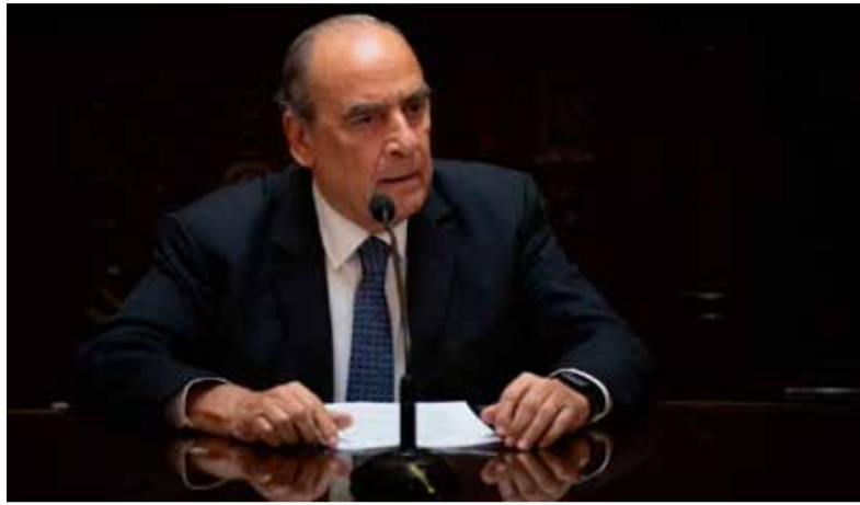
Francos. Plantea negociar con Unión por la Patria en el Congreso

importantes, particularmente la Ley Bases”, detalló.