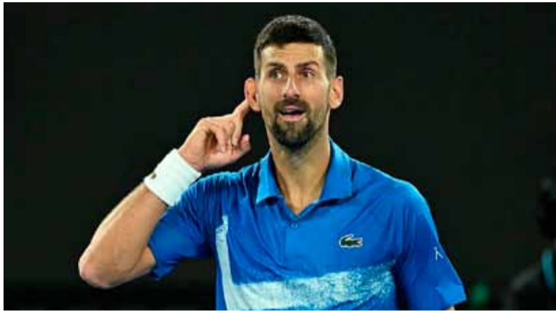
Djokovic. Alcanza las semifinales tras vencer a Alcaraz

Así fue como Djokovic, gracias a la efectividad de sus golpes y a la ayuda de un Alcaraz que no supo manejar la situación,