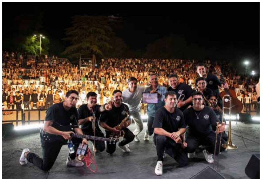
Nazarenas, Peñi-Huen, Suyan, y el cierre con Vinales y Ulises. Sin dudas, el 44° Festival