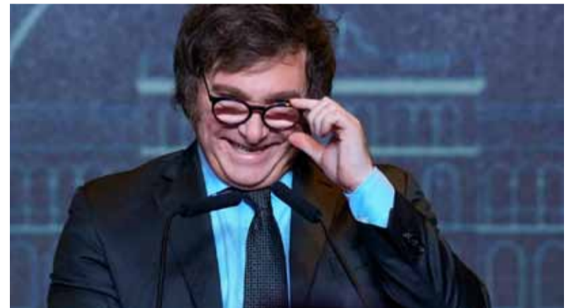
Milei. Apuntó contra la ideología woke

“Estamos ganando en libertad y lo que ustedes están proponiendo es el regreso a la censura”, concluyó, lo que le valió el respaldo del libertario.///