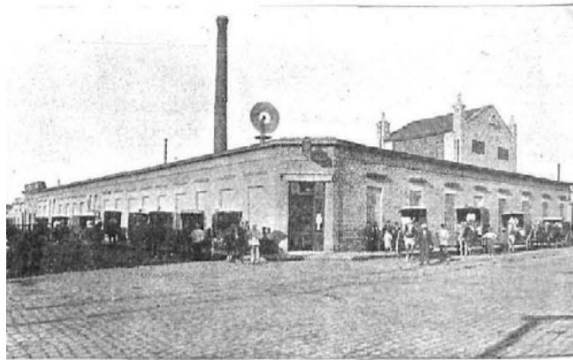
REPÚBLICA ARGENTINA. - BUENOS AIRES. LA MARTONA, VISTA GENERAL DEL DEPÓSITO CENTRAL.

La primera "usina lechera" del país fue finalmente instalada por Vicente Casares en la estancia "San Martín" luego de la visita del productor a Exposi-