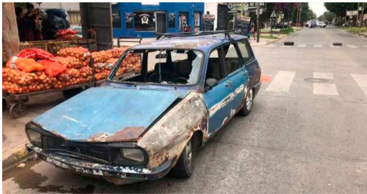
Una víctima fatal. Tras el atropello de un conductor alcoholizado

Un hombre manejaba borracho y a toda velocidad en la localidad bonaerense de San Francisco Solano atropelló a tres mujeres y mató a una de ellas, de 76 años. Mientras que otra fue arrastrada en el capot del auto y quedó internada en grave estado.