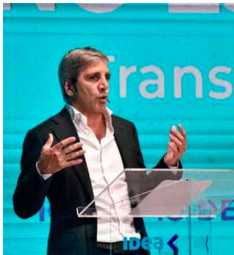
Anuncio. Caputo sale a postergar vencimientos de deuda

CUPÓN CON AJUSTE POR CER VENCIMIENTO 30 DE JUNIO DE 2025 (TE5) BONCER TZX25 30/06/2025 $ 2.093,58