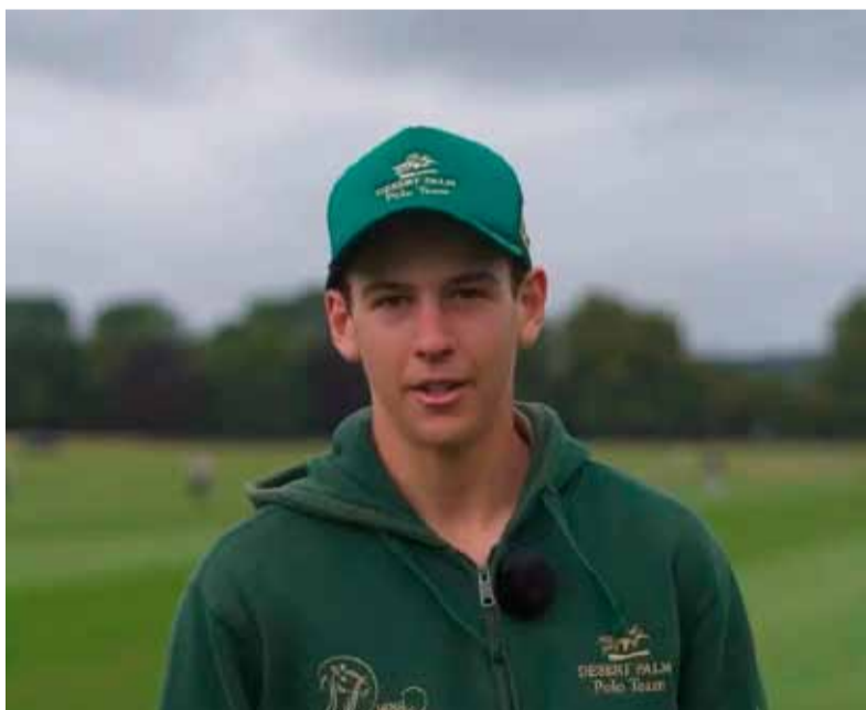
Luto en el polo. Tras la muerte de una joven promesa