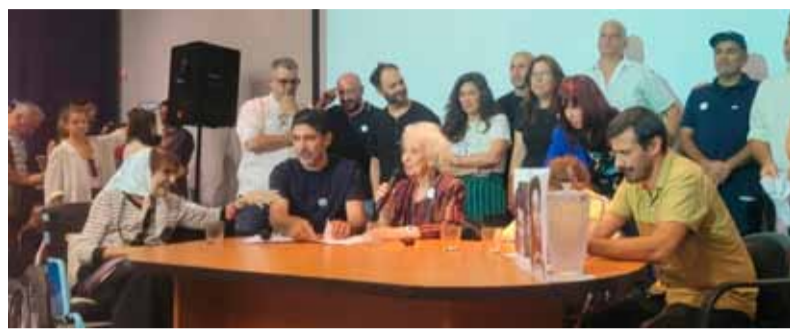
Abuelas de Plaza de Mayo. Celebra la restitución número 139