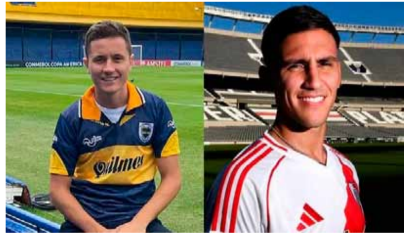
Boca y River. Protagonistas del mercado de transferencias