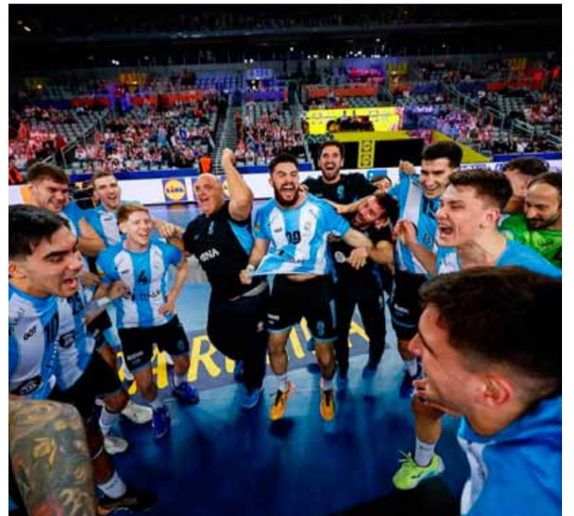
Argentina. Debuta en la segunda etapa del Mundial de handball

Eslovenia, por su parte, viene de quedar segundo en el Grupo G, donde superó a Cuba y Cabo Verde (41-19 y 36-24 respectivamente) y cayó ante Islandia por 23-18, en un ajustado encuentro. Los europeos van en busca de su primer título mundial, torneo en el que tuvieron como mejor resultado el tercer lugar obtenido en 2017.///