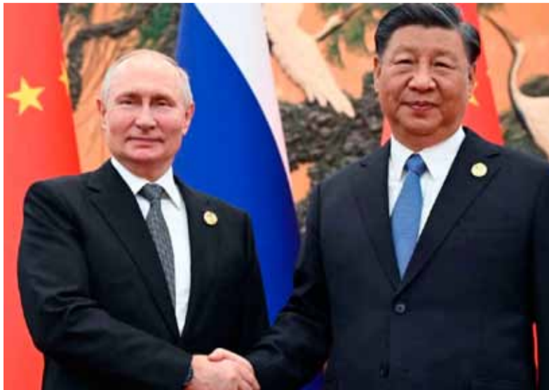
Potencias. Buscan consolidar su alianza antes de cambios en EE.UU.

Además, dijo que China y Rusia deben defender conjuntamente el sistema internacional centrado en la Organización de las Naciones Unidas (ONU) y los frutos de la victoria de la Segunda