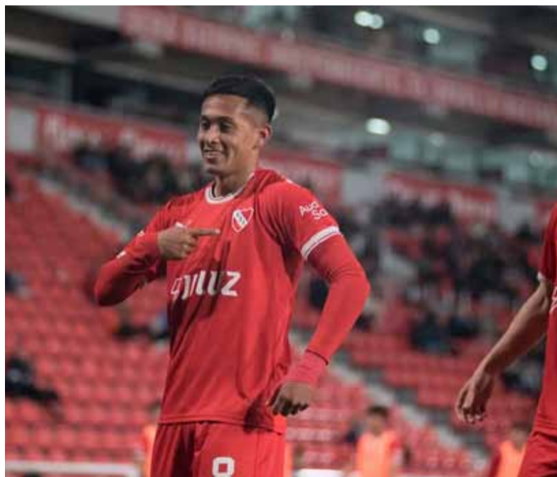
Atencio. Confirma su salida del club para jugar en Brasil

Además, el mediocampista mostró su deseo de volver al club