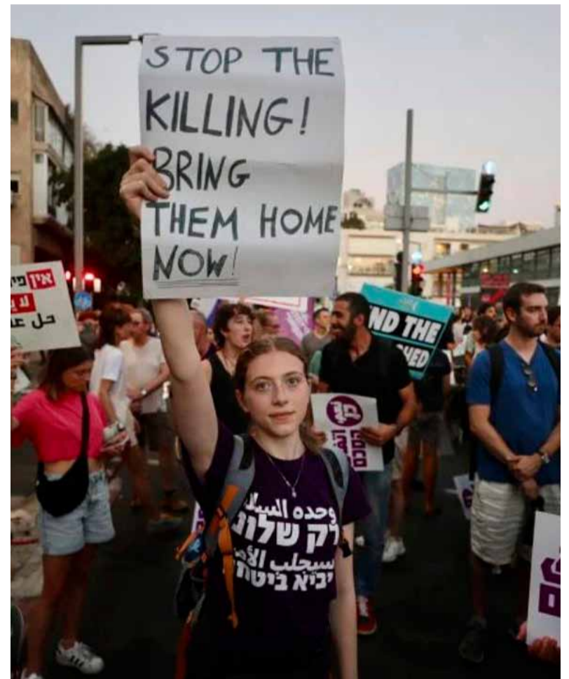
Hamás. Anuncia la liberación de rehenes en próximos días

Como parte del acuerdo de alto el fuego entre Hamás e Israel, la administración de Benjamin Netanyahu liberó a 90 prisioneros palestinos.///